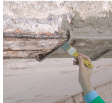
2. Demir donatı KÖSTER Adex ile kaplanır.