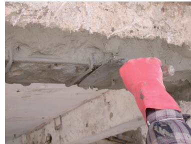
3. KÖSTER Repamor ile tamirat tamamlanır.