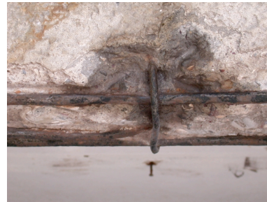
1. Demir donatı pastan arındırılır.

Çimento içerir. Koruyucu eldiven, gözlük ve elbise kullanınız. Göz ve deri temasından kaçınınız. Deri teması halinde bol su ve sabun ile yıkayınız. Göz teması halinde bol su ile yıkayınız ve hemen bir doktora başvurunuz. Profesyonel kullanım içindir, çocukların ulaşamayacağı yerde saklayınız.